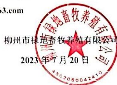
图3 项目环境影响评价信息第二次公示内容

联系电话：17772006329 联系邮箱：lzshrkj0772@163.com