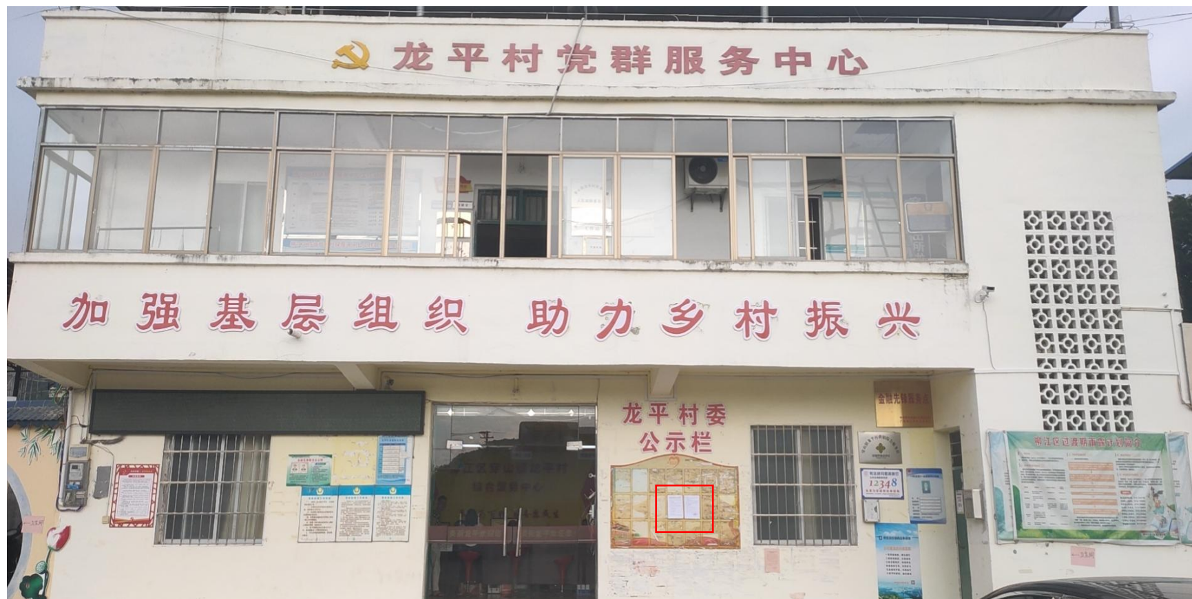
图 7 项目环评第二次公示现场张贴图片