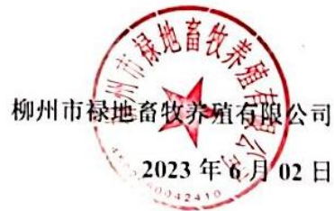
图 1 项目环境影响评价信息第一次公示内容