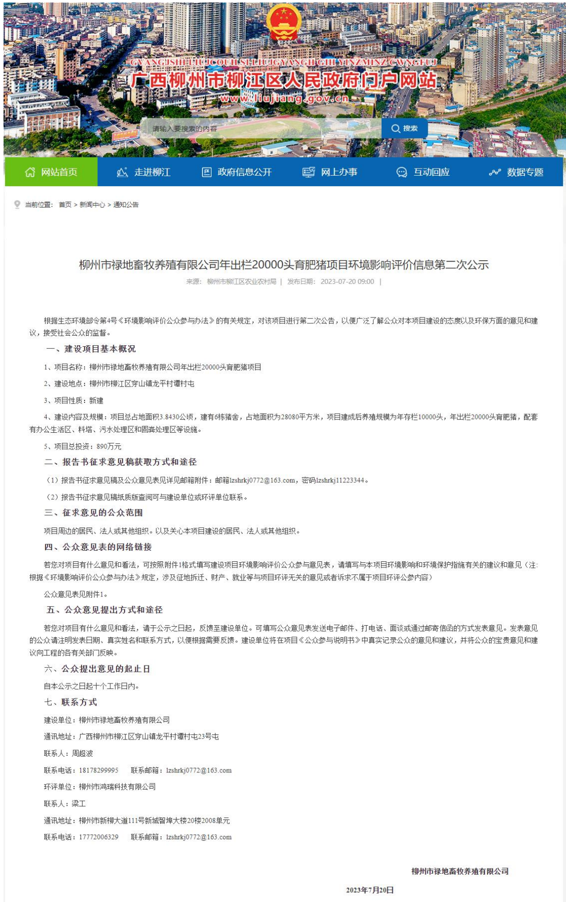
图 4 项目在广西柳州柳江人民政府门户网站第二次公示网上截图